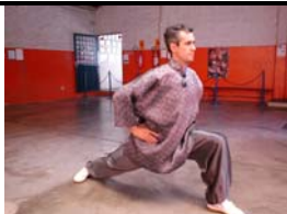
KON-BU (ARCO E FLECHA)